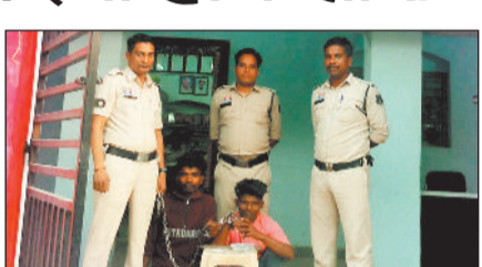
मंदिर की दानपेटी से नकदी चोरी करने वाले दो आरोपियों को पुलिस ने गिरफ्तार कर लिया है।

रायगढ़। मंदिर की दानपेटी से नकदी चोरी करने वाले दो आरोपियों को पुलिस ने गिरफ्तार कर लिया है। पकड़े गए आरोपियों में एक आरोपी हाल ही में चोरी के मामले में जेल से जमानत पर रिहा हुआ था, जिसने बाहर आते ही अपने साथी के साथ मिलकर मंदिर में चोरी की वारदात को अंजाम दिया। पुलिस ने दोनों आरोपियों को गिरफ्तार कर न्यायिक रिमांड पर भेज दिया है।