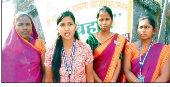
महिलाएं आत्मनिर्भरता और सशक्तिकरण की नई मिसाल प्रस्तुत कर रही हैं।

रायगढ़। जिले की ग्रामीण महिलाएं आत्मनिर्भरता और सशक्तिकरण की नई मिसाल प्रस्तुत कर रही हैं। छत्तीसगढ़ राज्य ग्रामीण आजीविका मिशन विद्यान के माध्यम से स्वसहायता समूहों से जुड़कर महिलाएं न केवल आर्थिक रूप से मजबूत हो रही हैं, बल्कि समाज में अपनी अलग पहचान भी बना रही हैं।