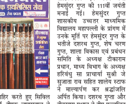
डायलिसिस सुविधाओं का लाभ ले रहे हैं ओडिशा के मरीज

जिला चिकित्सालय सारंगढ़ स्वास्थ्य सेवाओं के क्षेत्र में नित नए कीर्तिमान स्थापित कर रहा है। डायलिसिस सेवा के विस्तार के बाद से अब तक कुल 679 सेशन सफलतापूर्वक पूरे किए जा चुके हैं। गुणवत्तापूर्ण उपचार और आधुनिक मशीनों को उपलब्धता के कारण यहाँ मरीजों की संख्या में निरंतर वृद्धि हो रही है। जिला चिकित्सालय में मिल रही सुविधाओं से प्रभावित होकर ओडिशा के सीमावर्ती क्षेत्रों से भी मरीज नियमित रूप से यहाँ पहुंच रहे हैं।