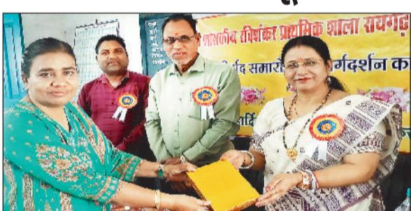
रविशंकर प्राइमरी स्कूल में आशीर्वाद समारोह