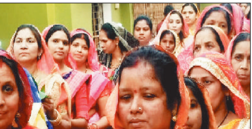
शनिदेव स्थापना महोत्सव: निकली कलश यात्रा

पुसौर। तहसील मुख्यालय पुसौर में भगवान शनिदेव का भव्य मंदिर के साथ उनकी स्थापना को अब तक 22 वर्ष हो चुके हैं इस स्थापना को श्रद्धालु जनों के सहयोग से मंदिर के संचालकों द्वारा प्रति वर्ष एक महोत्सव के रूप में मनाते रहे हैं। जिसके लिए पुरी सिद्ध से जहां तैयारी की जाती है वहीं श्रद्धालुओं का लगाव भी दर्शनीय रहता है। हाली के आसपास यह हायोजन होता रहा है और कभी कभी अपरिहार्य कारण वय समय को आगे पीछे किया जाता है इसी कड़ी में बीते शुक्रवार को स्थापना के महोत्सव को लेकर कलश यात्रा का आयोजन हुआ जिसमें नगर के मातृशक्तियों कलश लेकर अग्र्य लाने बड़े तालाब गए इनके आगे बाहर से लाए गए जात्रा पार्टी का जयथा रहा जो आकर्षण के केन्द्र बना जिसके फलस्वरूप लोग घर से निकल कर जहां मनोरंजन