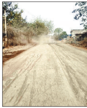
उड़ते धूल से दुकानदार व आवागमन करने वाले हैं परेशान

सरसीवां नगर से सरायपाली मुख्य मार्ग पर उड़ती हुई धूल के गुब्बारे लोगों की सेहत के लिए खतरा बन रहा है। जहां लोग उड़ते धूल से हलाकान से परेशान हो चले हैं। जिससे उड़ते गुब्बारे जैसे धूल से लोगों के सेहत पर गहरा असर पड़ रहा है लोगों को सांस लेने में परेशानी हो रही है।